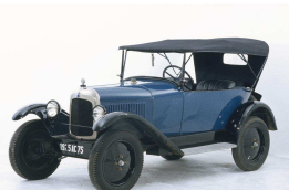
CITROËN C3 5HP (1922-1926) Les Dossiers documentaires du Conservatoire CITROËN